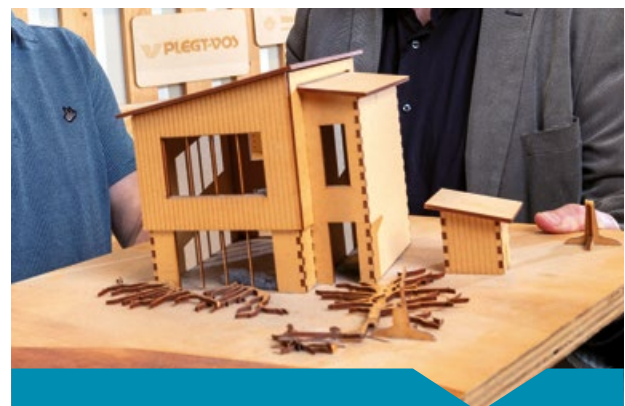
Hogeschool Saxion www.saxion.nl