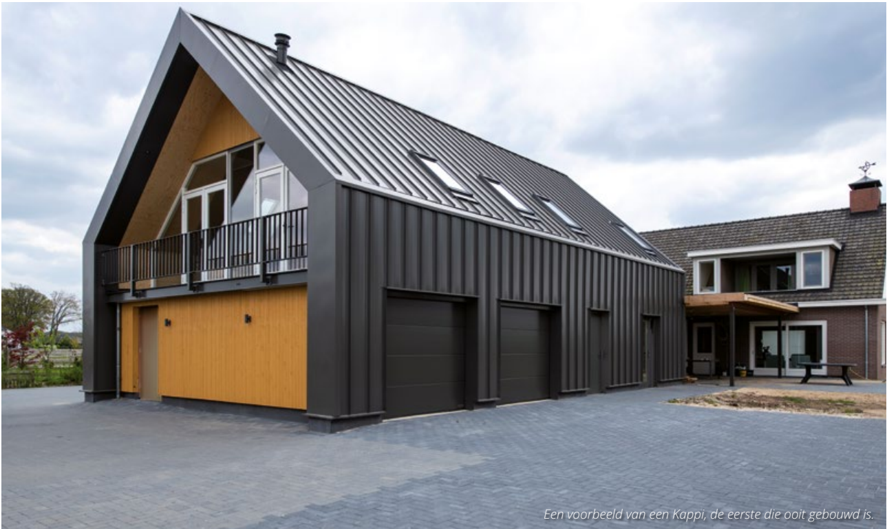
Een voorbeeld van een Kappi, de eerste die ooit gebouwd is.