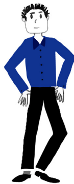
Figuur 1: De politieke ambtsdrager binnen de gemeente.

De afbeeldingen in dit hoofdstuk laten zien hoe actief een doorsnee raadslid of wethouder binnen de lokale samenleving is. Je kunt met een kandidaat-raadslid of kandidaat-wethouder een gesprek voeren over integriteit en veiligheid. Vaak blijft dit abstract, theoretisch en toekomstgericht. De echte integriteits- en veiligheidskwesties ontstaan in de vele contacten die raadsleden en wethouders hebben. Deze contacten ontstaan uit hoofde van vorige werkzaamheden, huidige politieke activiteiten, connecties in de buurt of via familie en kennissen. Naast de positieve kanten van deze contacten is het van belang de weerbaarheid van de kandidaten tegen integriteits-schendingen en antidemocratische dreigingen te vergroten door het gesprek over integriteit en veiligheid te hebben met het beeld van een netwerk voor ogen. Pas dan worden de mogelijke risico's voor bijvoorbeeld belangenverstrengeling en intimidatie en bedreiging tastbaar.