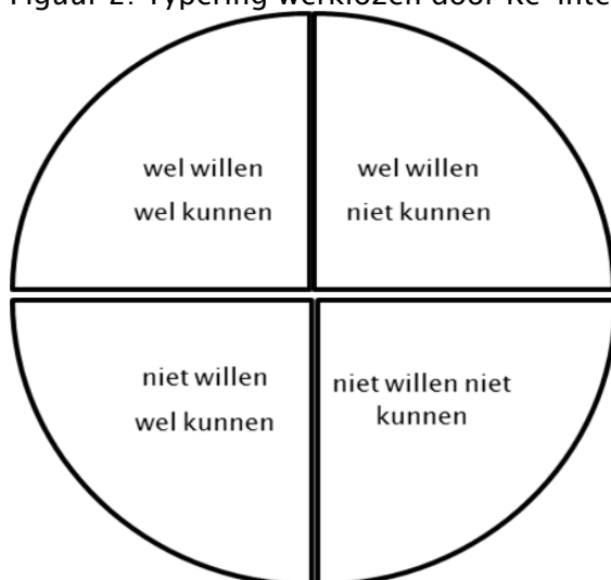
Figuur 2: Typering werklozen door Re-integratie organisatie 1