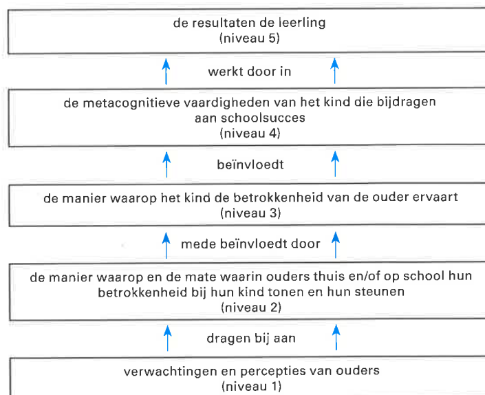
Figuur 3 Revised Hoover-Dempsey and Sandler model of the parental involvement process (2005) vereenvoudigd

Ook leerkrachten en schoolleiders moeten zich bewust zijn welke verwachtingen of opvattingen zij over (groepen) ouders hebben en de wijze waarop dit hun uitnodigende houding naar ouders beïnvloedt.