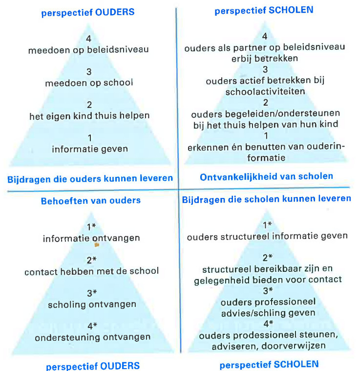
Figuur 4 Factoren, zowel vanuit ouders als vanuit scholen, die bijdragen aan de verschillende aspecten van ouderbetrokkenheid (Cijvat/Voskens, 2008).

De twee piramides naast elkaar geven aan dat het perspectief van de ouders en het perspectief van de school complementair zijn aan elkaar. Het gaat met andere woorden steeds om een wisselwerking tussen school en ouders. Bijvoorbeeld: Om er voor te zorgen dat aan de behoefte van ouders aan een goed contact met de school wordt voldaan, moet de school er voor zorgen dat er voldoende gelegenheid is om dat contact tot stand te brengen en te onderhouden. Daarbij hoort dat men ook andersom kan formuleren: als de school uitnodigt tot contact, moeten de ouders daar ook op ingaan.