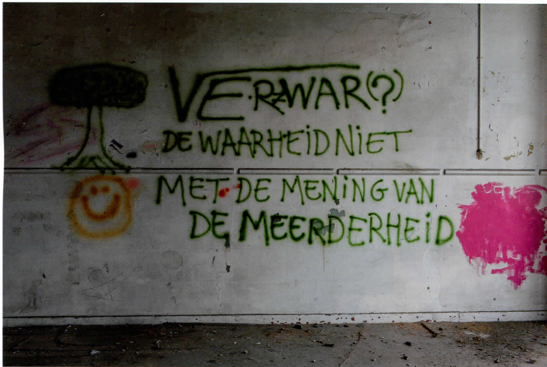
Graffiti Houtmarktschool Deventer.

van hun taalvaardigheid vraagt en, tot slot, wat dat betekent voor het onderwijs in het algemeen en voor het taalonderwijs in het bijzonder.