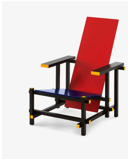
Gerrit Rietveld: Rood-blauwe stoel 1923 Geveerd hout 66 x 87 x 83 cm Collectie Stedelijk Museum Amsterdam

Is 'De Schreeuw' van Munch juist mooi en indrukwekkend door de kwaliteit van de schilderkunst? Of wekt de angst van de rare figuur op de voorgrond juist afkeer?