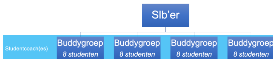
Figuur 1: Structuur buddygroep, studentcoach(es) en slb'er

In figuur 1 is schematisch een voorbeeld weergegeven voor een klas met 32 studenten en één studentcoach per vier buddygroepen. Deze werkelijke structuur is aan de opleiding om te bepalen.